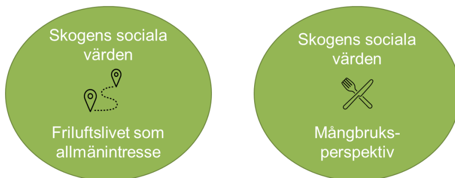
Figur 1: Skogens sociala värden uppdelade i två sinsemellan kompletterande perspektiv: 1) Friluftslivet som allmänintresse, inklusive skötsel och hänsyn vid skogsbruksåtgärder, och 2) Mångbruksperspektiv på skogens sociala värden, där skogsägarens drivkraft och vilja att utveckla skogens upplevelsevärden är centrala.

lokala förankring är viktig 18 och ger förutsättningar för dialog och samverkan om skogens upplevelsevärden med kommersiella och icke-kommersiella aktörer.