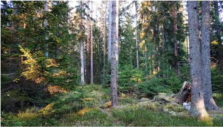
Flerskiktad skog, lämplig för hyggесfritt.