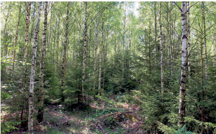
Gran under björkskärm.

Hyggesfritt skogsbruk är oftast ett skonsammare sätt att bruka skogen, vilket också gör att många arter har större möjlighet att finnas kvar jämfört med en kalavverkning.