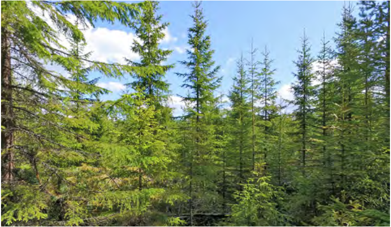
Skiktad grandominerad ungskog