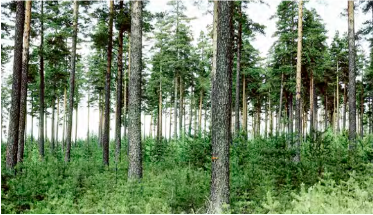
Överhållen skärm.