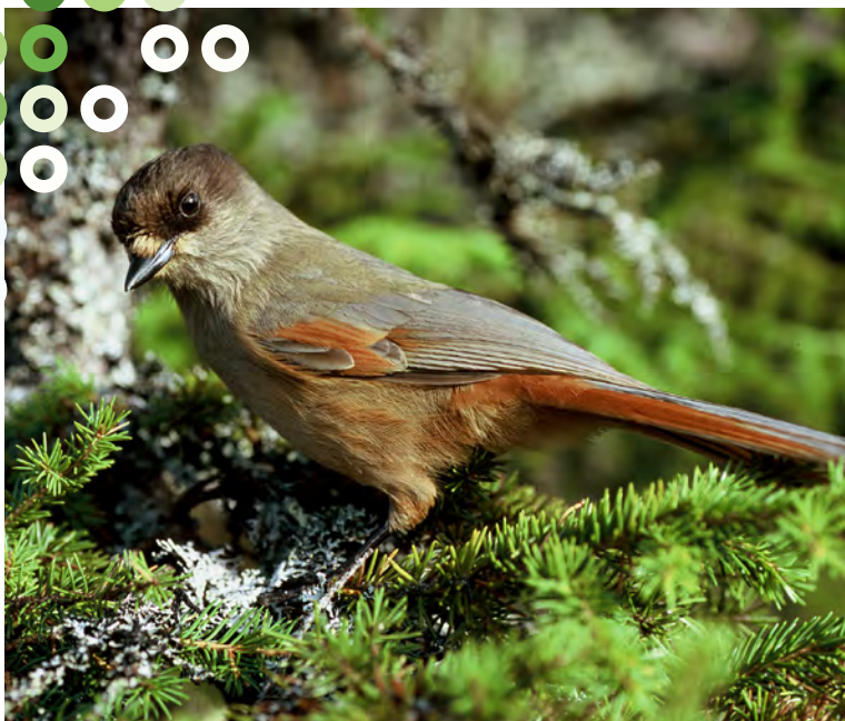
Skogslevande fåglar gynnas av hyggesfritt.